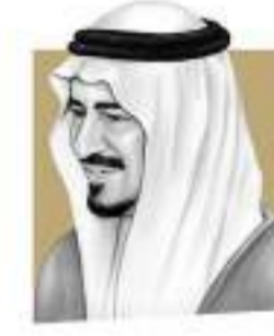
مؤسسة الملك خالد KING KHALID FOUNDATION